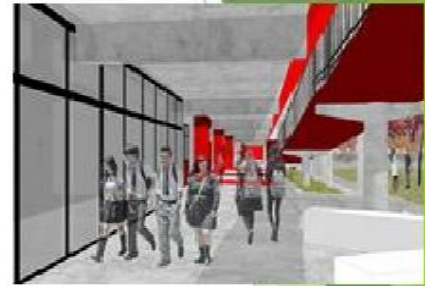
VISTA INTERIOR NUEVOS ESPACIOS EDUCATIVOS, 2021