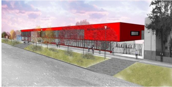
Vista por calle Molina Lavín