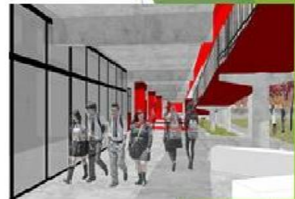
VISTA INTERIOR NUEVOS ESPACIOS EDUCATIVOS, 2021