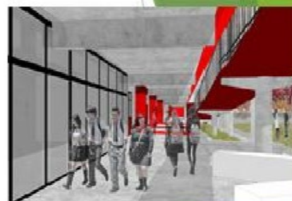
VISTA INTERIOR NUEVOS ESPACIOS EDUCATIVOS, 2021